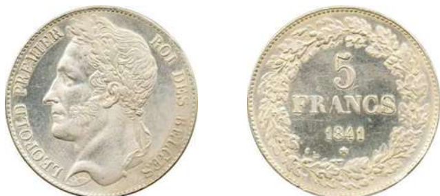
NBFB 122 – “5 FRANK 1841” zonder merkteken

De rand van deze stukken is glad (dus zonder inschrift of opschrift). Ze hebben allemaal een zwak geslagen A in FRANCS en de jaartallen zijn in een ander lettertype dan de authentieke stukken (vgl. 2 en 2). Ook het gewicht is nooit correct.