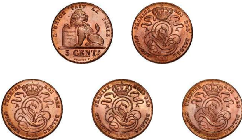
NBFB-14 – “5 CENTIMES 1811-1861” zonder merkteken