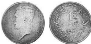
NBFB-92 – “1 FRANC 1918” met vermelding COPY

Deze vervalsingen van de stukken uit Birmingham zijn eigenlijk makkelijk te herkennen : alle bekende echte stukken zijn in topkwaliteit, en de valse niet; bovendien hebben de cijfers 7 en 8 op deze vervalsingen een vorm die afwijkt van die op echte stukken.