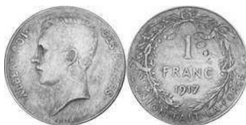
NBFB-91 – “1 FRANC 1917” met vermelding COPY