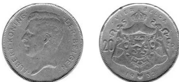
NBFB-146 – “20 FRANK / 4 BELGA 1932”