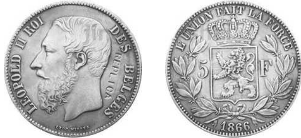
NBFB-125 – “5 FRANK 1866” met vermelding REPLICIA