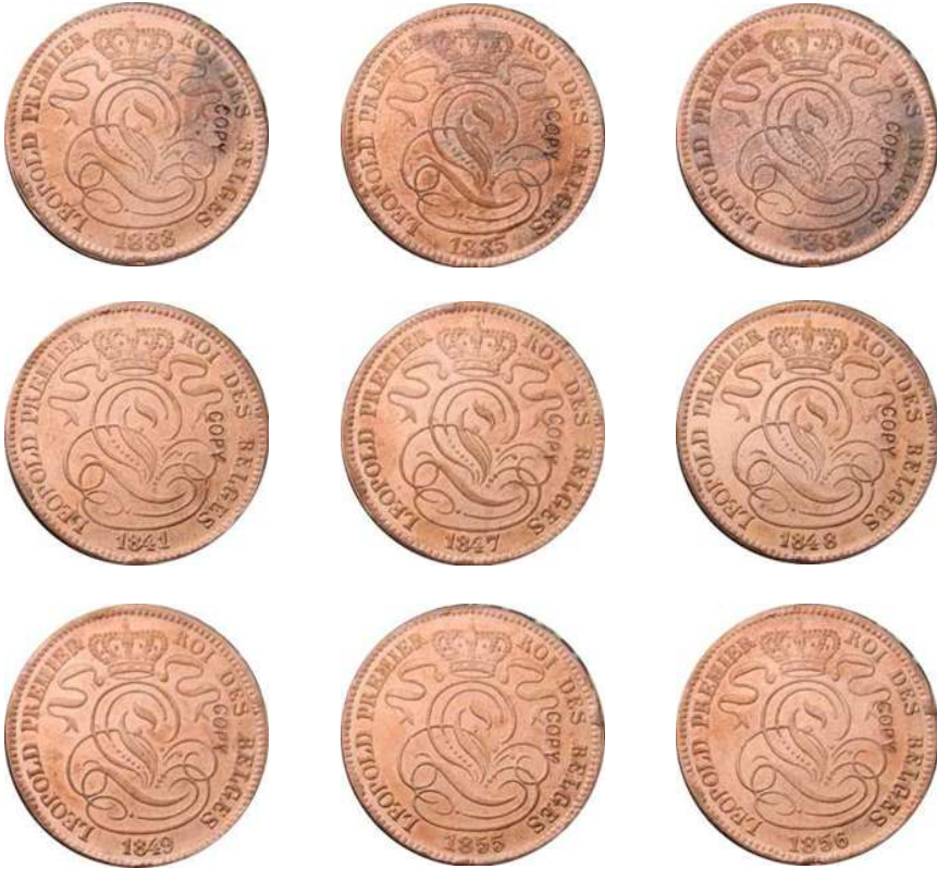
NBFB-31 – “10 CENTIMES 1833-1856” met vermelding COPY