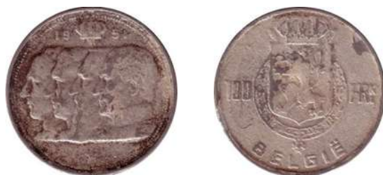
NBFB-174 – “100 FRANK 1951”

Van deze eigentijdse vervalsingen is het gewicht bijna nooit goed. Controleer dat dus het eerst (de afwijking mag niet meer dan 2% bedragen t.o.v. het standaardgewicht).