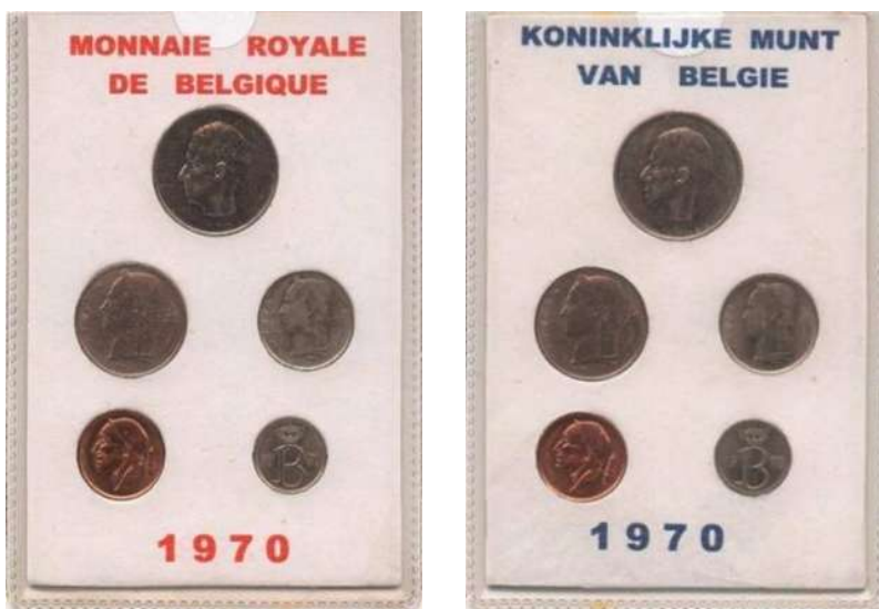
Valse sets (schaal 60%)

Ook sets worden vervalst. Daarbij wordt de verpakking nagemaakt, en worden er dan gewone circulatiemunten in gestoken. De valse verpakkingen zijn te herkennen aan de opdruk in dikkere letters en cijfers dan op de echte sets.