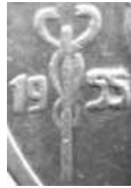
20 FRANK 1955 uit 1953