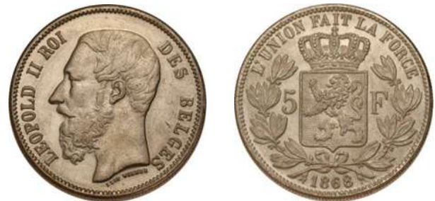
NBFB-125 – “5 FRANK 1868” zonder merkteken ( let op de graveursnaam onder de hals )