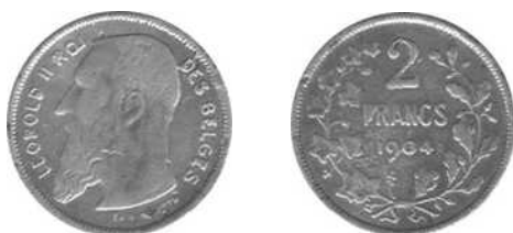
NBFB-113 – “2 FRANCS 1904”