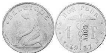
NBFB-95 – “1 FRANC 1931” met vermelding COPY ( niet magnetisch )

Deze vervalsingen van de stukken uit Birmingham zijn eigenlijk makkelijk te herkennen : alle bekende echte stukken zijn in topkwaliteit, en de valse niet; bovendien hebben de cijfers 7 en 8 op deze vervalsingen een vorm die afwijkt van die op echte stukken.