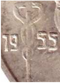
20 FRANK 1955 (echt)