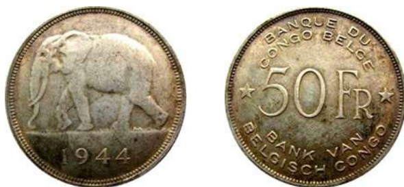
NBCO-B20 – “50 FRANK 1944” zonder merkteken

Ook sets worden vervalst. Daarbij wordt de verpakking nagemaakt, en worden er dan gewone circulatiemunten in gestoken. De valse verpakkingen zijn te herkennen aan de opdruk in dikkere letters en cijfers dan op de echte sets.