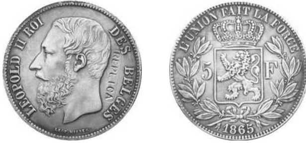
NBFB-125 – “5 FRANK 1865” met vermelding REPLICIA