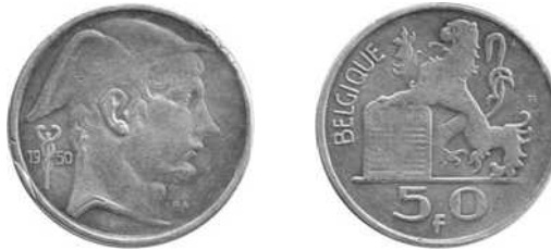
NBFB-162 – “50 FRANCS 1950” zonder merkteken