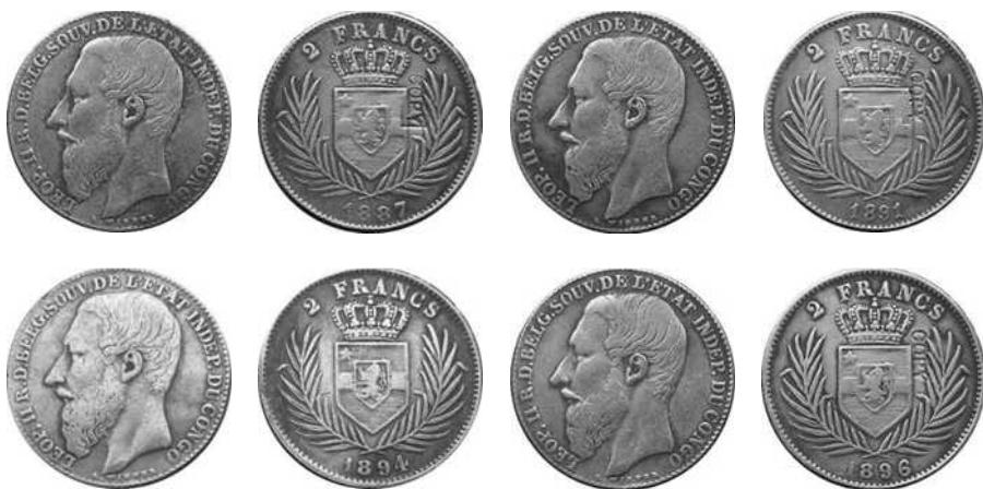
NBCO-A10 – “2 FRANCS 1887-1896”, sommige met vermelding COPY

Enkele andere voorbeelden van Chinese vervalsingen (controleer steeds het gewicht !).