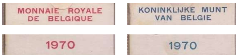
Echte exemplaren (schaal 60%)

EEN GEWAARSCHUWD VERZAMELAAR IS ER TWEE WAARD !