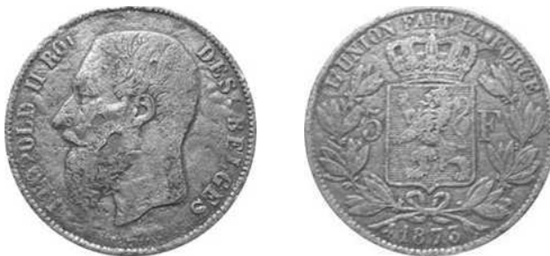
NBFB-125 – “5 FRANCS 1873”