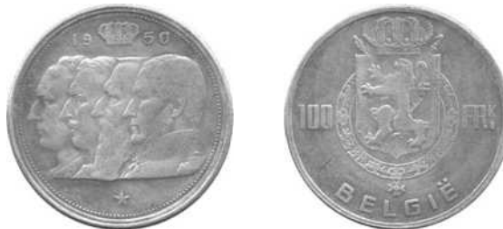
NBFB-174 – “100 FRANK 1950” zonder merkteken