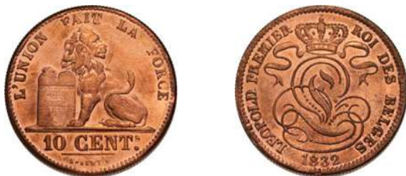
NBFB-31 – “10 CENTIMES 1832” zonder merktkenen