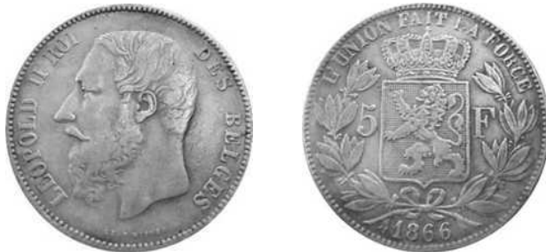
NBFB-125 – “5 FRANK 1866” zonder merkteken ( let op de afwijking in het cijfer 6 )