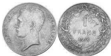
NBFB-91 – “1 FRANC 1918” met vermelding COPY