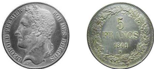
NBFB 122 – “5 FRANK 1841” met vermelding REPLICA ( incuus )