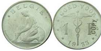
NBFB-96 – “1 FRANK 1933” met vermelding COPY ( niet magnetisch )