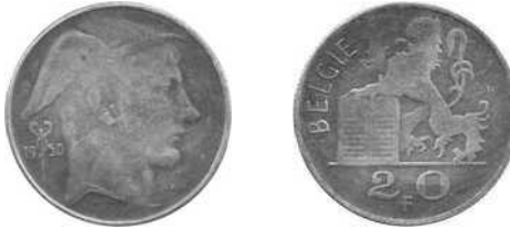
NBFB-152 – “20 FRANK 1950” zonder merkteken