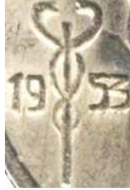
20 FRANK 1953 (echt)