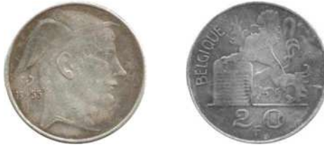
NBFB-151 – “20 FRANCS 1955” zonder merkteken