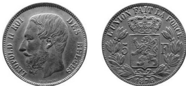
NBFB-125 – “5 FRANK 1878” zonder merkteken ( enkel gekend als proefstuk )